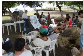
Taller de Zonificación participativa del área comunitaria para pesca responsable en Tárcoles, Julio 2007.

“La experiencia de casos de manejo de recursos pesqueros por comunidades locales ha mostrado que aporta significativamente a la recuperación de los recursos pesqueros, a la capitalización de cooperativas, empresas y gremios de pescadores, a la mejoría sustancial de los precios y ha posibilitado la inserción de las organizaciones de pescadores en la comercialización de sus productos. (...)”